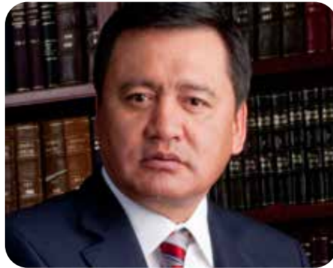
Miguel Ángel Osorio Chong