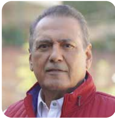
Manlio Fabio Beltrones