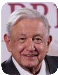
Andrés Manuel López