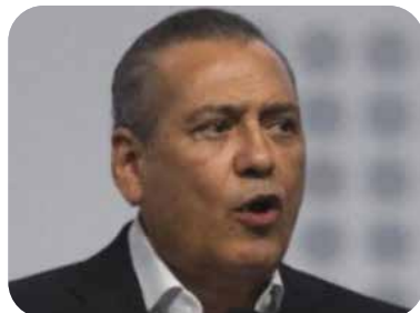
Manlio Fabio Beltrones